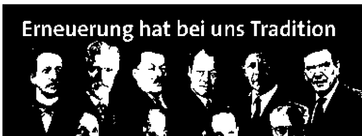
Erneuerung hat bei uns Tradition

SozialdemokratenInnen wurden wegen ihrer Überzeugungen verfolgt und ermordet. SozialdemokratenInnen haben schon immer Verantwortung für Deutschland übernommen, von wegen "vaterlandslose Gesellen". Politische Veränderungen erzielen wir nicht mit der großen Harmonie im Schlafwagen, sondern sie müssen erstritten, ja auch erkämpft werden.